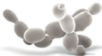
Levadura Saccharomyces cerevisiae (Grupo Lallemant)

LalVigne RESILIENS™ , aplicado de forma preventiva, permitirá incrementar la tolerancia del viñedo ante cualquier situación de estrés abiótico que pueda sufrir, aumentando su capacidad de resistencia y manteniendo su potencial productivo y cualitativo.